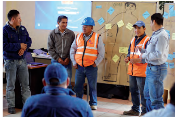
Participantes presentan su trabajo en grupo sobre roles de hombres.

Si bien este trabajo al inicio puede presentar resistencias, como por ejemplo participantes que no consideran que el tema sea importante para ellos por no ser violentos, en el desarrollo del taller se va generando una mayor apertura y acogida, por cuanto se reflexiona sobre patrones socio-culturales que al estar tan naturalizados no son fácilmente reconocidos y a, la vez, se presentan los beneficios directos en el bienestar de todas las personas, especialmente de los propios hombres, todo ello además desde las vivencias e intervenciones de los participantes.