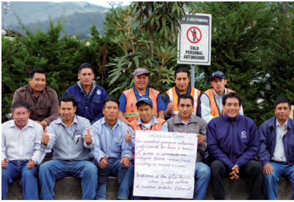
Participantes que han asumido compromiso de tolerancia cero frente a la VcM.

Es fundamental entrenar a facilitadores porque luego ellos continúan estos procesos ampliando el dialogo entre hombres, realizando campañas y/o replicando conocimientos adquiridos, con lo cual se generan capacidades para absorber una demanda cada vez más creciente.