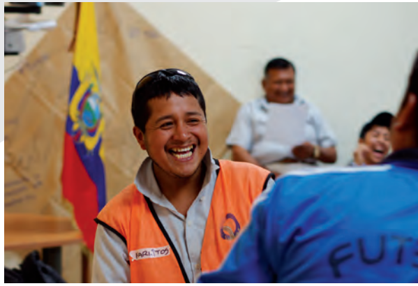
Participantes de uno de los talleres sobre masculinidades.

En Ecuador se trabaja, desde el 2012, masculinidades y prevención de la violencia contra las mujeres básicamente con el sector empresarial. En primer lugar, el grupo empresarial ENDESA-BOTROSA y su empresa Provemundo, con una mayoría de hombres en su personal, desarrollaron capacidades para formar un grupo de promotores para que estos repliquen los conocimientos adquiridos no solo al interior de las empresas, sino también en las comunidades en las cuales intervienen. Hasta el momento, son 900 hombres capacitados.