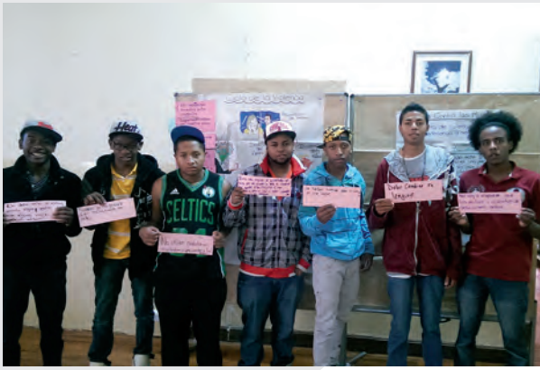
Jóvenes de Fundación Azúcar con compromisos personales de cambio.