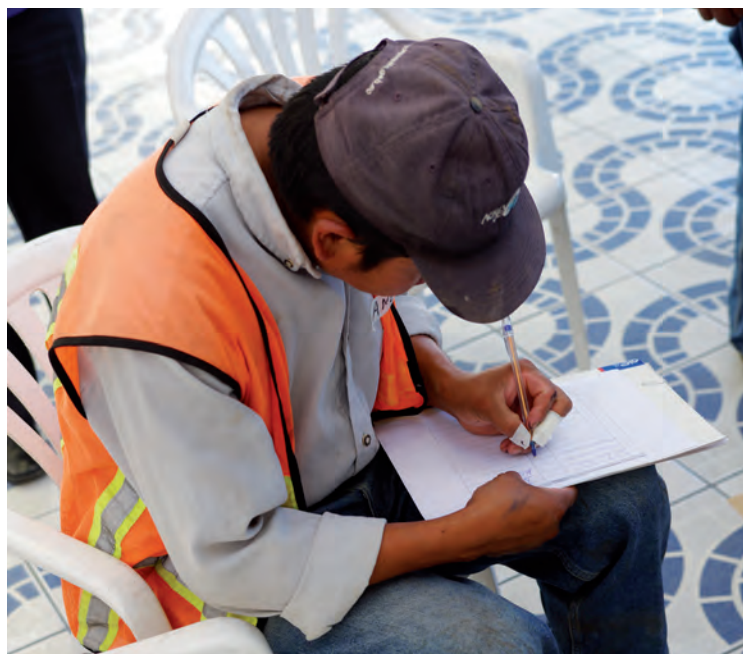
Participante inscribiéndose en curso.

Es importante mencionar el potencial de cambio de esta medida, ya que luego de procesos de capacitación y sensibilización, varios de los hombres asistentes manifestaron abiertamente una voluntad de cambiar. Sin embargo, como el entrono (ámbito laboral, familiar y sociedad) mantiene los roles y estereotipos tradicio-