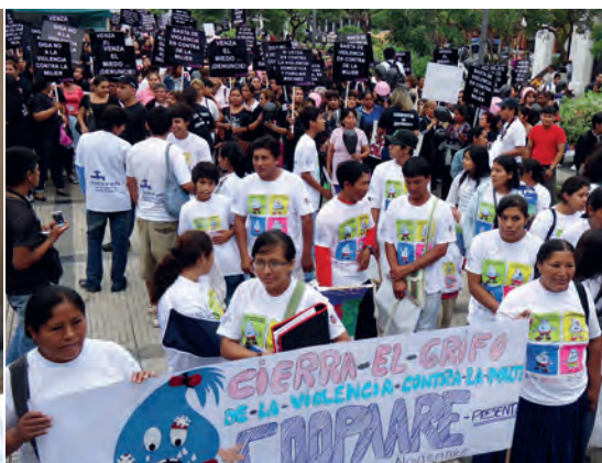
Links: Regionale Konferenz „Stimmen der Würde“, 2013.